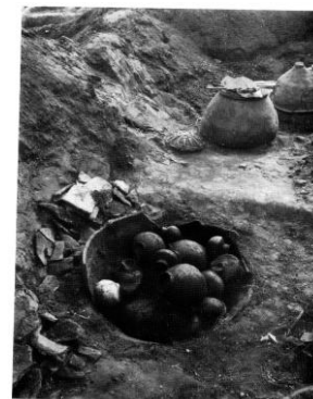
Journées du patrimoine