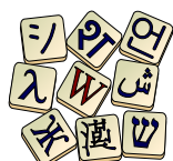
Wiktionnaire Le dictionnaire libre

Le Dictionnaire des francophones rassemble diverses ressources à son lancement, bientôt suivies de nombreuses intégrations dans les mois à venir : l' Inventaire des particularités lexicales du français en Afrique noire (AUF), le Wiktionnaire francophone , le Dictionnaire des synonymes, des mots et expressions du français parlé dans le monde (Académie des sciences d'Outre-Mer), Le Grand Dictionnaire terminologique (OQLF), l'ouvrage Belgicisms - Inventaire des particularités lexicales du français en Belgique (Conseil International de la Langue Française), le Dictionnaire des régionalismes de France (ATILF), et la Base de données lexicographiques panfrancophone (Université Laval), FranceTerme (DGLFLF) - en cours d'intégration. Les trois premières sont diffusées sous licence libre CC BY-SA 3.0 tandis que les quatre suivantes sont diffusées sous licence CC BY-SA-ND 4.0.