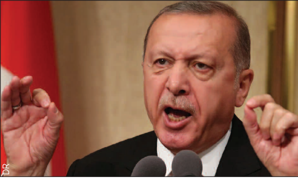
Chantage à l'Europe, offensive blindée en territoire syrien, neutralisation des combattant Kurdes et des relations ambiguës avec la Russie et les Etats-Unis. Le président Erdogan à la manœuvre