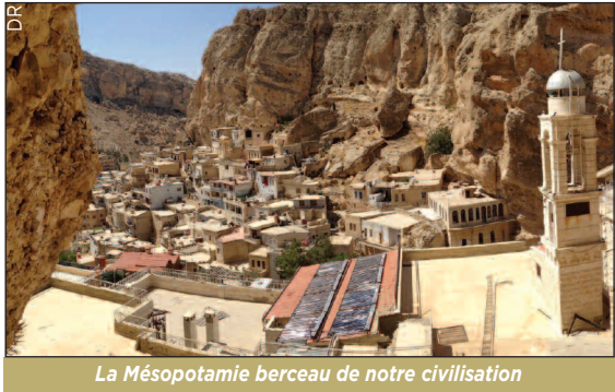
La Mésopotamie berceau de notre civilisation