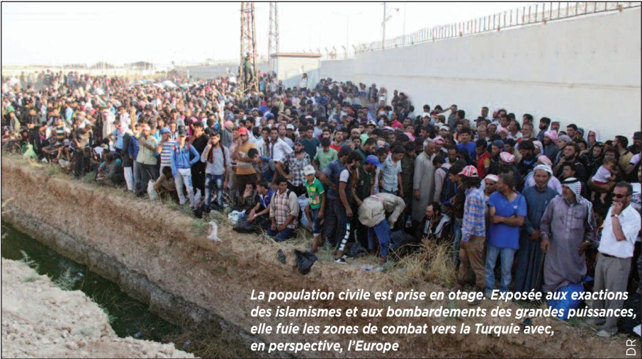
La population civile est prise en otage. Exposée aux exactions des islamismes et aux bombardements des grandes puissances, elle fuit les zones de combat vers la Turquie avec, en perspective, l'Europe