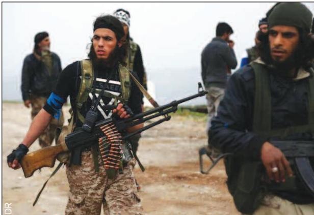
Combattants kurdes quittant la lutte contre l'état islamique

rait sûrement pas être acceptable par Damas et son allié russe, sans compter le risque d'enlèvement des forces turques d'un côté et une augmentation d'actions terroristes qui seraient menées par le YPG ou le PKK, y compris sur le sol turc. De surcroît, cet enlèvement éventuel ne serait pas pour déplaire aux voisins du pays de la « Sublime porte ».