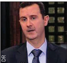
Que peut-il faire ?

Les dirigeants français, ministres des Affaires étrangères en tête, n'ont eu de cesse, de façon peu diplomatique, d'exprimer publiquement que le président Assad devait être chassé du pouvoir. Cette prise de position n'a pu qu'augmenter le capital de défiance de Damas vis-à-vis de Paris. Déjà, au cours du mandat français, la