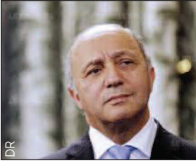
Une vision idéologique