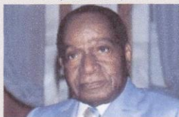
FÉLIX HOUPHOUËT-BOIGNY (1905-1993)