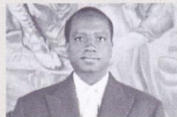
MODIBO KEITA (1915-1977)

Réputé pour sa maîtrise de l'art oratoire, Barthélémy Boganda fonde son propre parti en 1950, le Mesan (Mouvement d'évolution sociale de l'Afrique noire). Son credo : l'émancipation de l'homme noir et la lutte contre l'exploitation coloniale. Elu en 1957 à la présidence du Grand Conseil de l'Afrique équatoriale française, qui réunit entre autres le Tchad et le Gabon, il défend l'idée d'Etats-Unis de l'Afrique latine. Il proclame en 1958 à Bangui la République centrafricaine, mais périt quelques mois plus tard dans un crash d'avion.