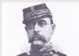
LOUIS FAIDHERBE (1818-1889)

Militaire de carrière, polytechnicien, Louis Faidherbe se voit confier l'administration du Sénégal à partir de 1854, date à laquelle il prend ses fonctions de gouverneur. Dès 1855, il fonde la Banque du Sénégal, puis l'«Ecole des otages» pour la formation des cadres locaux, ainsi qu'un tribunal musulman. En parallèle, Faidherbe enregistre de nombreuses victoires militaires et pose les jalons de l'expansion française au Soudan. Il est considéré aujourd'hui comme le premier grand technicien de la colonisation française en Afrique noire.