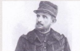
JEAN-BAPTISTE MARCHAND (1863-1934)

Fasciné par Robinson Crusoé, René Caillié est l'incarnation de l'explorateur. A 17 ans, cet apprenti cordonnier décide de partir pour Tombouctou (Mali), après avoir appris que la Société de géographie offrait une récompense à celui qui, le premier, décrirait la ville. Cette dernière est interdite depuis toujours aux chrétiens. Pour arriver à ses fins, Caillié apprend les rudiments de l'islam et se lance dans un périple à pied entre Dakar et Tombouctou. Parvenu à son but en 1828, il en tire un récit, Voyage à Tombouctou .