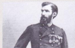
PIERRE SAVORGNAN DE BRAZZA (1852-1905)