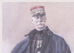
JOSEPH GALLIENI (1849-1916)

Nommé maréchal de France à la fin de sa carrière, Joseph Gallieni ne s'est pas illustré qu'en remportant la bataille de la Marne. Son action en tant qu'administrateur en Afrique, notamment au Soudan français (actuel Mali), se traduit par la réalisation de multiples équipements, jardins, marchés, routes, chemin de fer ou dispensaires. Mais c'est à Madagascar qu'il imprime le plus sa marque. Nommé gouverneur en 1896 (jusqu'en 1905), il doit pacifier le pays, mais s'évertue à le doter d'infrastructures (écoles, voies ferrées, ports...).