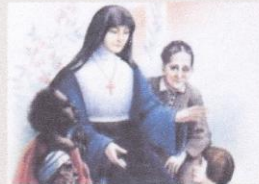
ANNE-MARIE JAVOUHEY (1779-1851)