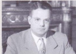
LOUIS-PAUL AUJOULAT (1910-1973)

L'attrance de Louis-Paul Aujoulat, d'origine pied-noire, pour les colonies, naît de sa visite de l'exposition coloniale de 1931 à Paris. Quatre ans plus tard, il effectue ses deux premières missions en tant que médecin au Cameroun et au Gabon et crée quelques mois plus tard la fondation Ad Lucem, à travers laquelle il développe un réseau de structures de soins. Engagé un temps en politique, en tant que député, puis ministre, il profite de ces leviers pour s'impliquer en faveur de l'émancipation politique des pays africains.