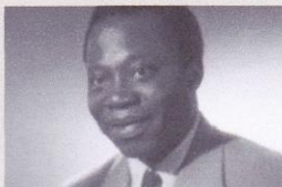
BARTHÉLÉMY BOGANDA (1910-1959)

Diplômé de médecine en 1925, Félix Houphouët-Boigny entre en politique quelques années plus tard. Indigné par les injustices subies par les cultivateurs de cacao ivoiriens, il prend la tête en 1932 d'un mouvement de planteurs africains hostiles aux grands propriétaires blancs. Il s'affirme alors sur la scène politique. Très attaché aux rapports avec la France, il décide à contre-cœur de proclamer l'indépendance de la Côte d'Ivoire en 1960. A sa tête durant trente ans, il développe notamment les infrastructures et l'éducation.