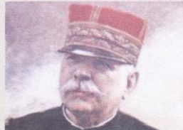
JOSEPH JOFFRE (1852-1931)

Elève de l'école du Génie de Fontainebleau, qu'il intègre après Polytechnique, Joseph Joffre se voit confier pour sa première mission en Afrique, en 1892, la coordination de la construction du chemin de fer Dakar-Niger. Un an plus tard, il se lance dans la campagne de Tombouctou (Mali), dont il sort vainqueur face aux Touaregs et qu'il ponctue d'une série d'aménagements d'envergure visant à pacifier la région. Rentré en France en 1903, après un détour par Madagascar, il est fait maréchal en 1916.