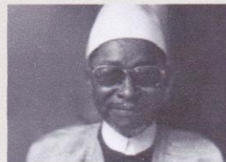
AMADOU HAMPÂTÉ BÂ (1900-1991)

Surnommé Majnun es-Sahra («le fou du désert») par les Bédouins, Théodore Monod fit parler de lui en 1927 en découvrant le fossile de l'homme d'Asselar au Mali, un type d'Homo sapiens négroïde datant de 6 000 ans avant notre ère. Scientifique (géologue et naturaliste) et grand connaisseur des régions sahariennes, il se passionna pour une autre quête qui le vit partir sur les traces d'un astéroïde en Mauritanie. Celle-ci, infructueuse, le conduisit à devenir un admirateur de ce désert auquel il voua ensuite son existence.