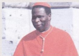
BERNARD GANTIN (1922-2008)