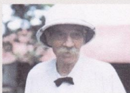
ALBERT SCHWEITZER (1875-1965)

Préoccupé très jeune par la souffrance des autres, le célèbre docteur Schweitzer pose les pieds sur le sol africain pour la première fois en 1913. Il propose à l'administration française de travailler à ses frais au Gabon, où il fonde son premier hôpital à Andendé. Incarcéré dans le sud de la France durant la Première Guerre mondiale, car considéré comme Allemand, il retourne au Gabon en 1924 où il construit un hôpital à Lambaréné, transformé en musée en 1981. Il recevra le prix Nobel de la paix en 1952.