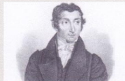
RENÉ CAILLIÉ (1799-1838)

Italien d'origine, Pierre Savorgnan de Brazza, naturalisé français en 1874, est l'une des figures de l'histoire coloniale en France. Marin chevronné, il se fait connaître en explorant le bassin du Congo. Arrivé à Itié (Mbé) en 1880, il signe un traité avec le roi Makoko Ilo 1 er qui cède son territoire à la France (devenu Congo-Brazzaville). Nommé par la suite commissaire général dans l'Ouest africain puis commissaire général au Congo, il est réputé pour être celui qui jeta les bases de l'Afrique équatoriale française.