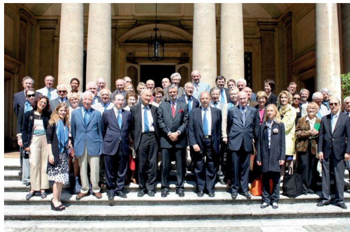
Rome, le 5 mai 2011 Villa Bonaparte, Ambassade de France auprès du Saint-Siège, réception par M. l'ambassadeur Stanislas Lefèbvre de Laboulaye. Durant le séjour, réceptions également au Prieur de l'ordre de Malte, à la Villa Médicis et échanges au Conseil pontifical pour les membres de l'Académie.